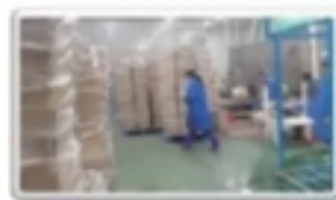
· 成品包装车间 ·