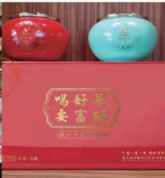
一县一特恩施富硒产品交易管理中心

品引入平台大宗交易，每个月产生 1 亿左右交易量，贵州茅台也签下 5000 万元恩施高粱采购合同，增加了农民的收入。同时，线上开设一县一特恩施馆（包括京东馆、天猫馆等），线下联动上万个生态餐馆、永辉、大润发等大型商超，将所有神农硒产品进行全渠道无缝对接，引入优质合作商和精准消费群体。2022 年，神农硒茶和白酒将全新升级入市，带来 8000 万元的额外收入。