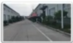
· 出库通道 ·

恩施是迄今为止“全球唯一探明独立硒矿床”所在地，在 2011 年 TEMA14 大会上被授予“世界硒都”殊荣。随着硒元素对人类健康的价值日益凸显，硒产业具有非常可观的市场前景。