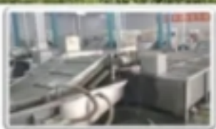
· 冷却车间 ·