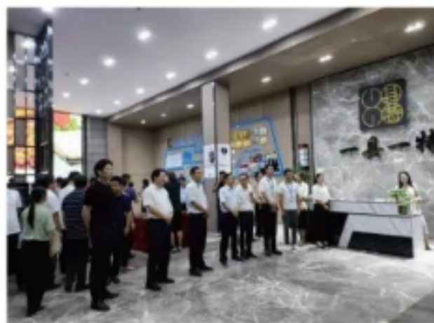
湖北省有关领导视察一县一特（荆州）交易管理中心

2020 年，中国一县一特云平台走进恩施成立分中心，组建专家团队和营销团队，开始了硒产品的产业化升级之路。一方面，联合本地龙头企业创立“神农硒”品牌，开发生产神农硒水、神农硒茶、神农硒酒等系列产品线，并入驻中国一县一特云平台。同时，对神农硒的源头包括星斗山水源、齐云春茶叶土壤、神农老窖水质都进行严格的勘察和检测，其硒的含量远高于同类产品，其中神农硒水在 2020 年南京农村电商供应链博览会上被授予“恩施《1 县 1 特》最佳富硒产品”。经过一年