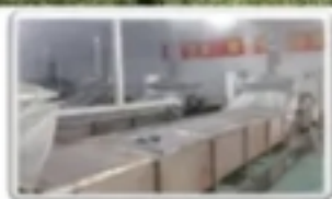
· 漂洗车间 ·