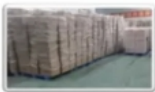
· 产品车间 ·