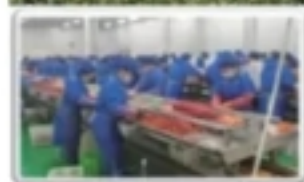
· 剥壳车间 ·