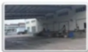
· 过磅窗口 ·