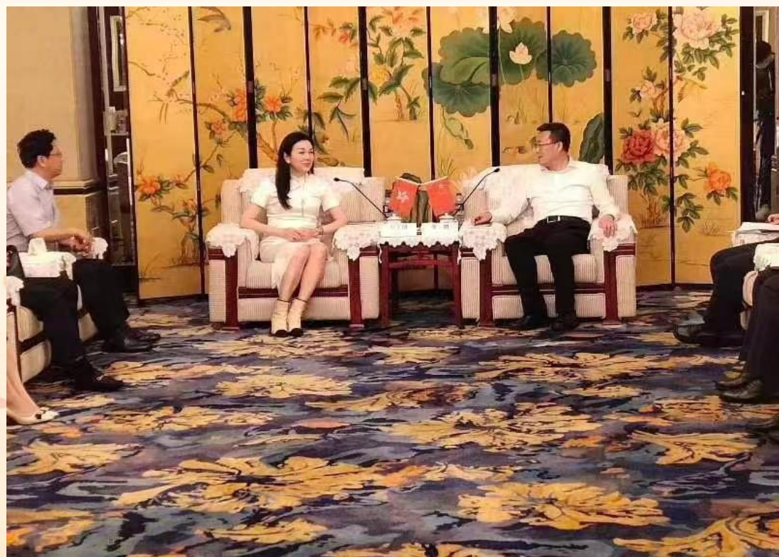
洪子晴爵士与邢鹏盘锦市委副书记、市长会谈