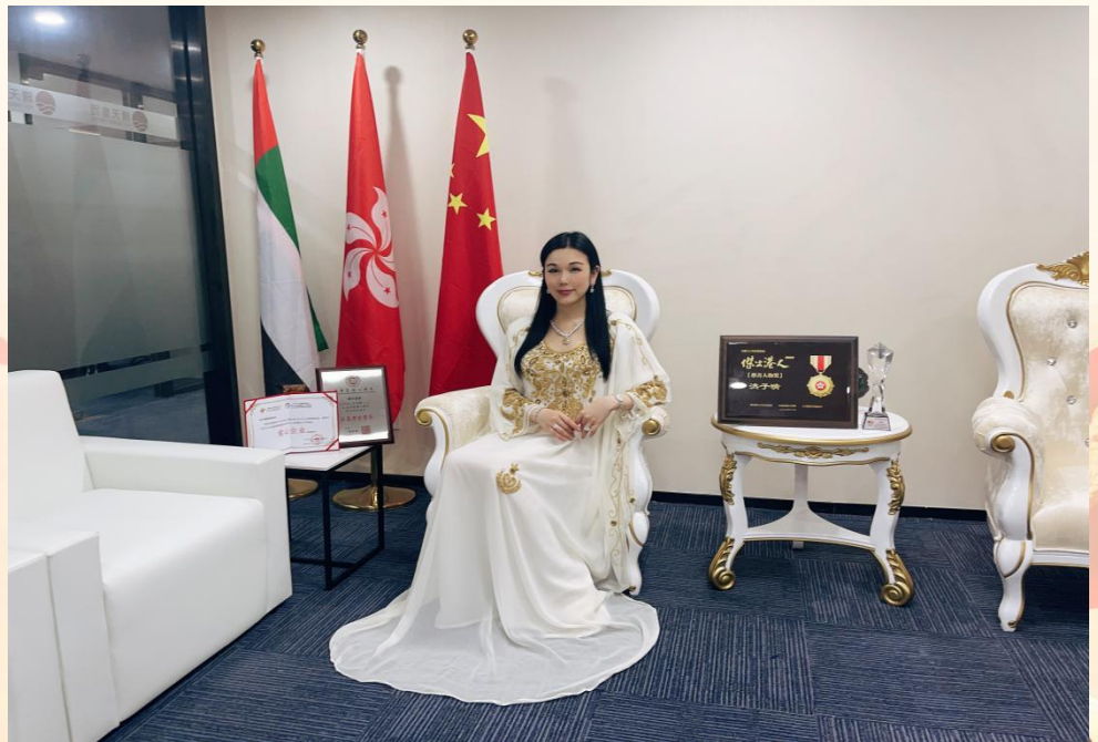
洪子晴爵士在她的晴天集團 13,000 尺的辦公室貴賓廳接受記者採訪

儿童心脏基金会、香港苗圃行动、保良局孤儿、仁爱堂、香港公益金、香港红十字会、无国界医生、世界宣明会、乐施会、香港华光功德会、联合国儿童基金会、匡智会、救世军、奥比斯眼科慈善基金会等。洪子晴博士数之不尽的善款和爱心捐赠,洪子晴博士还捐助善款给广