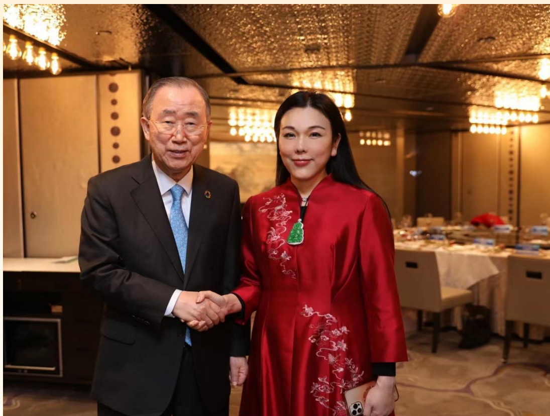
洪子晴爵士与联合国第八任秘书长潘基文阁下欢迎晚宴 暨中国企业家代表2023年香港迎新春联欢晚宴