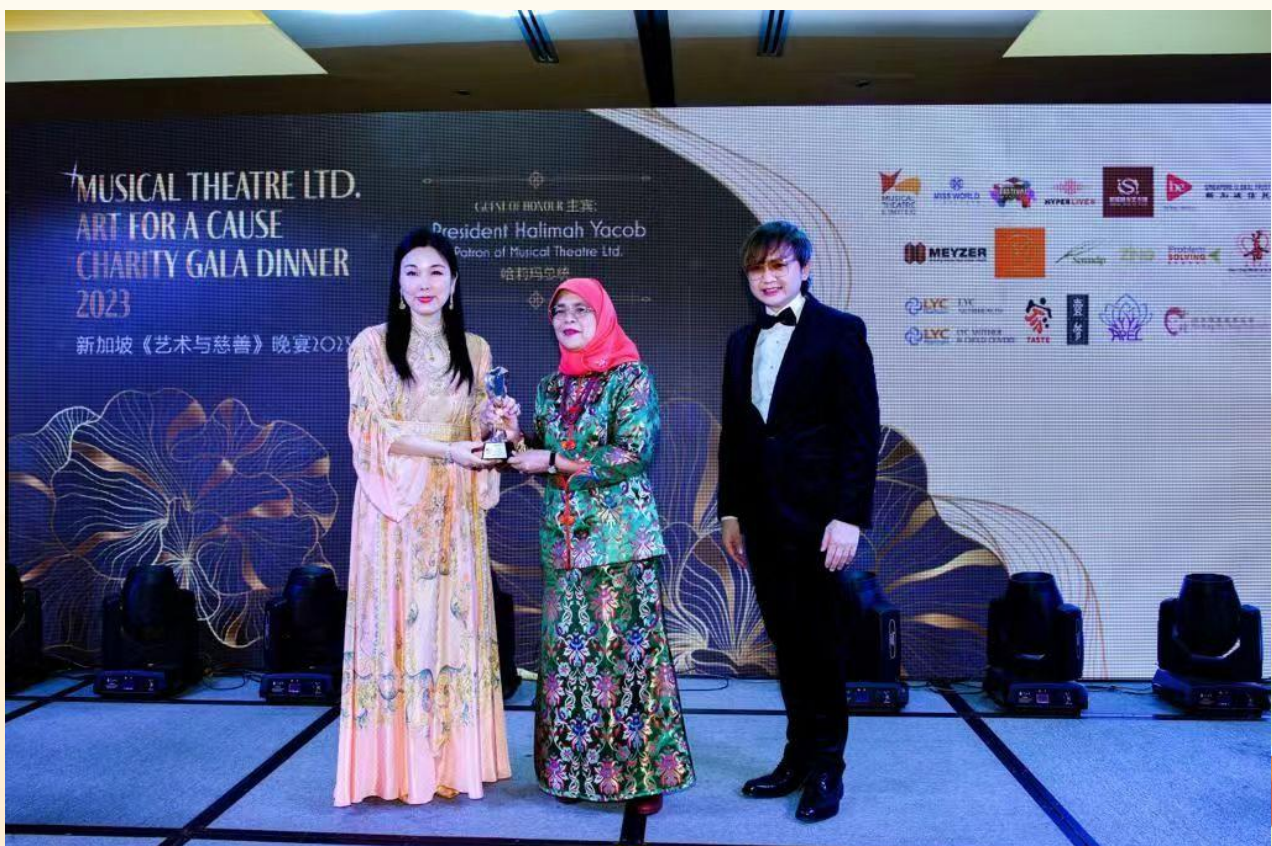
洪子晴爵士 荣获 新加坡总统哈莉玛 雅各布女士颁授艺术与慈善奖杯